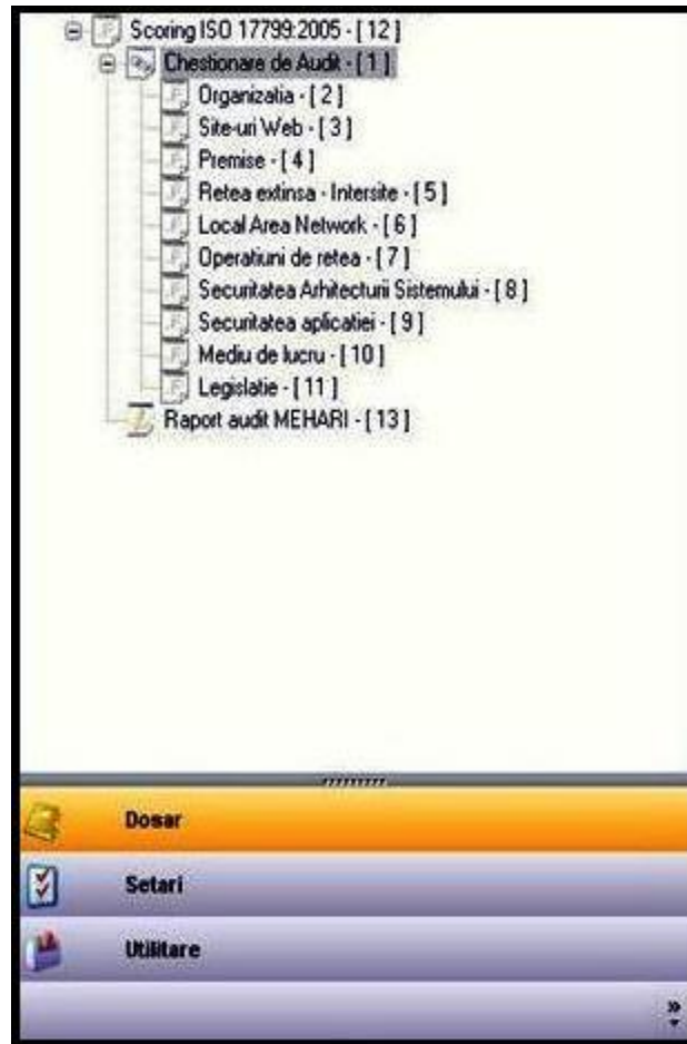
Structura generala a aplicatie